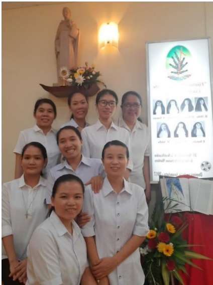
Nuestra Señora del Santo Rosario