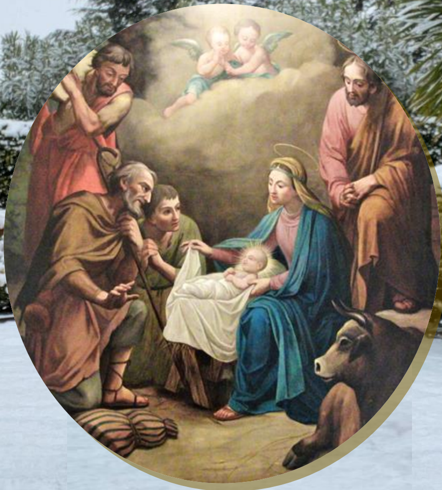
Detall tapis del Naixement. Casa Mare, J. Gallés 1888