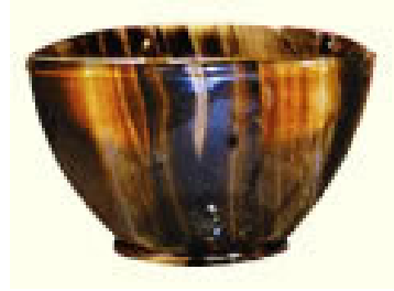
Sant Calze Catedral de València

Is 52,13-53,12 Tothom s'esglaià de veure'l. Ni tan sols semblava un home. Ell portava les nostres malalties. Sl 30 Pare, allibera'm per l'amor que em tens. He 4,14-16;5,7-9 Jesús de manera semblant a nosaltres ha estat provat en tot. Jn 18,1-19,42 Ave, rei dels jueus! Els soldats li donaven bufetades. Sortí Jesús portant la corona d'espines i el mantell de porpra. Pilat els diu: "Aquí teniu l'home".