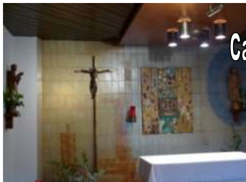
Capella del P. Coll, a Gombren