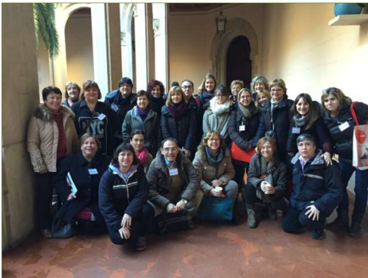
Professorat de la Fundació Educativa FEDAC que participaren en la 8a Jornada de Pastoral Educativa

Han estat unes bones jornades per aprendre i compartir amb mestres de diferents escoles de Catalunya les nostres inquietuds pastorals.