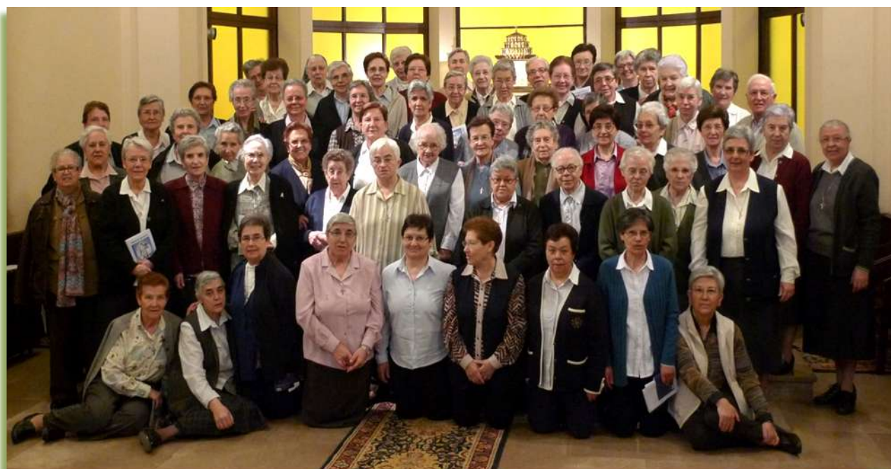
Vic, Casa – Mare. Setmana Santa de 2015

Vam finalitzar els nostres Exercicis espirituals el dissabte, 4 d'abril, després de dinar. Abans de marxar ens vam fer la tradicional foto de grup.