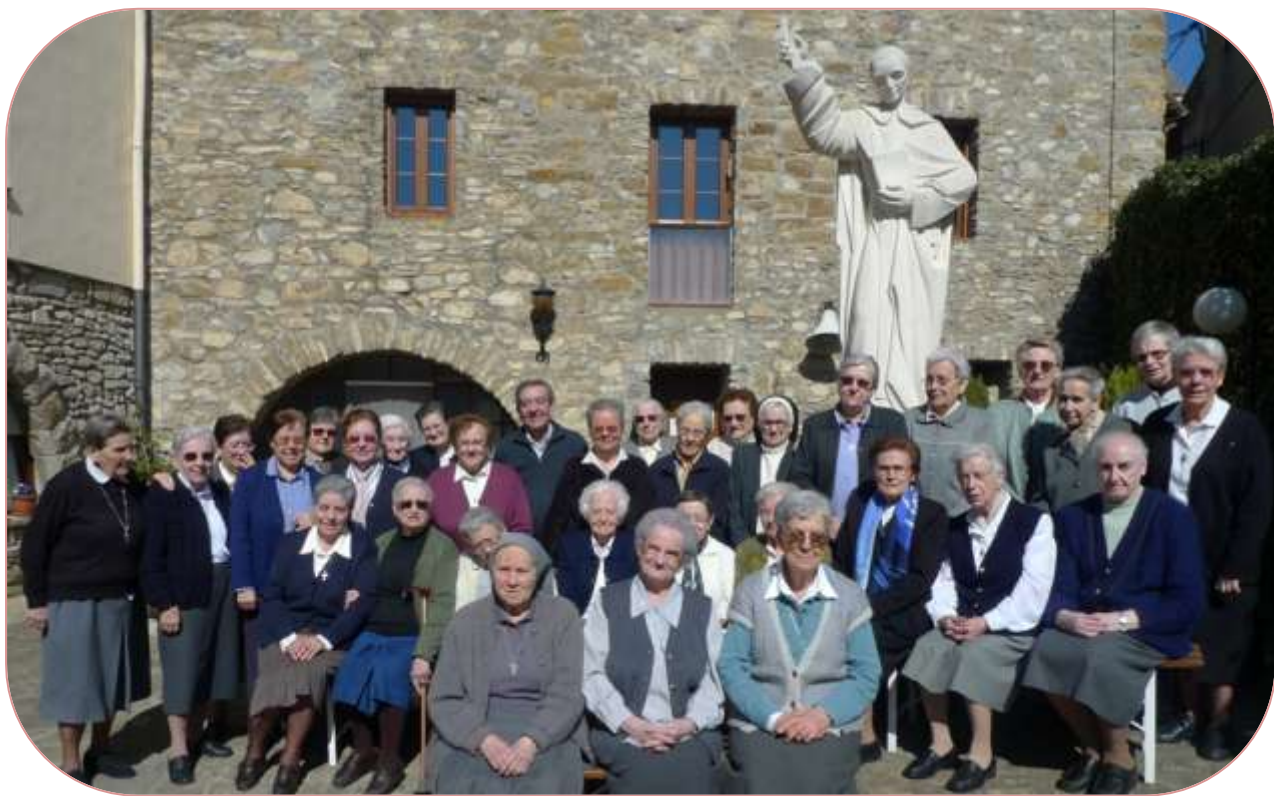
GRUP PARTICIPANT SOTA LA PROTECCIÓ DEL NOSTRE ESTIMAT PARE COLL

GRÀCIES, GRÀCIES, MOLTES GRÀCIES DE TOT!!!