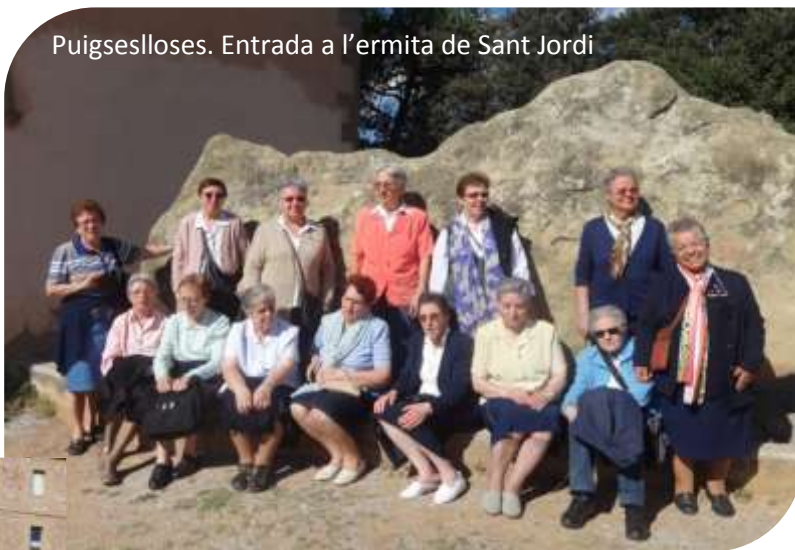
Puigseslloses. Entrada a l'ermita de Sant Jordi