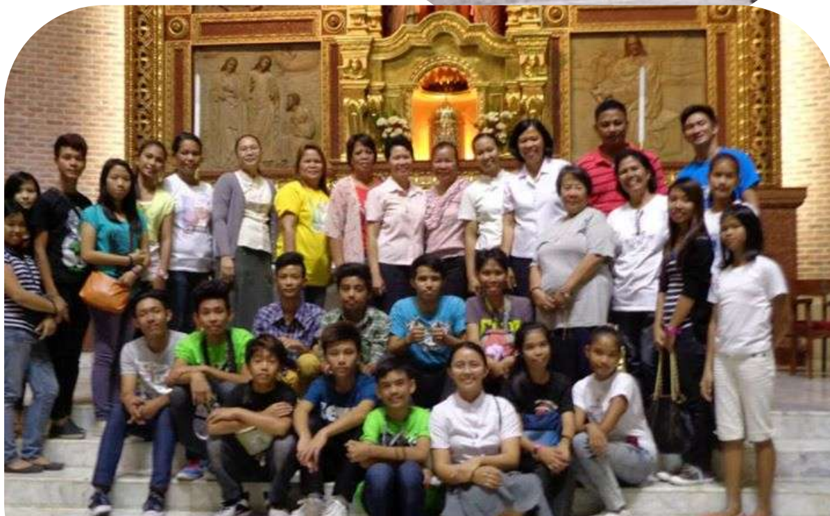
Les Germanes de la comunitat de San carlos i un grup de joves de la parròquia que les acompanyaren en la celebració.