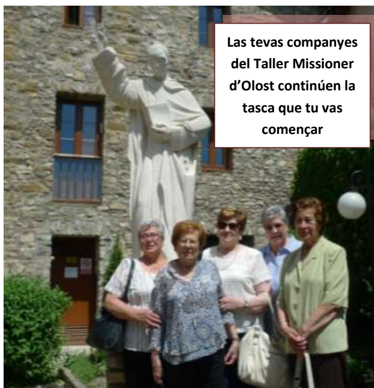
Las tevas companyes del Taller Missioner d'Olost continúen la tasca que tu vas començar