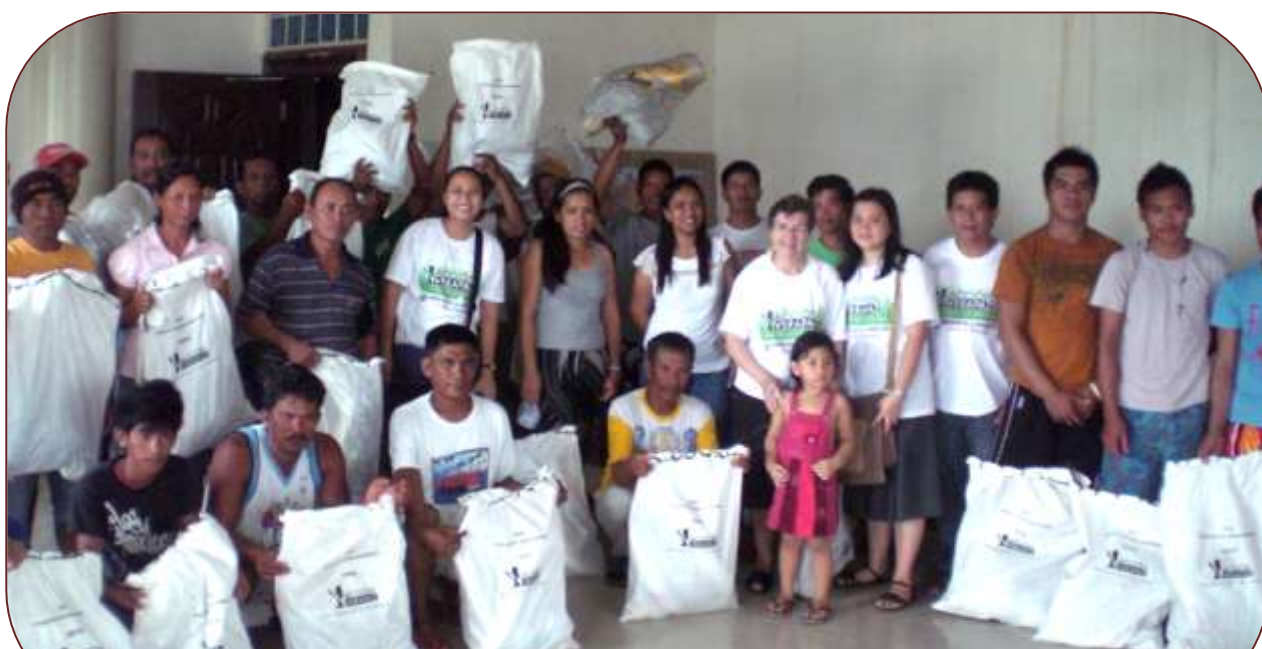
ALGUNS DELS BENEFICIAT DE LA DISTRIBUCIÓ DE XARXAR I D'ALTRES MATERIALS DE PESCA