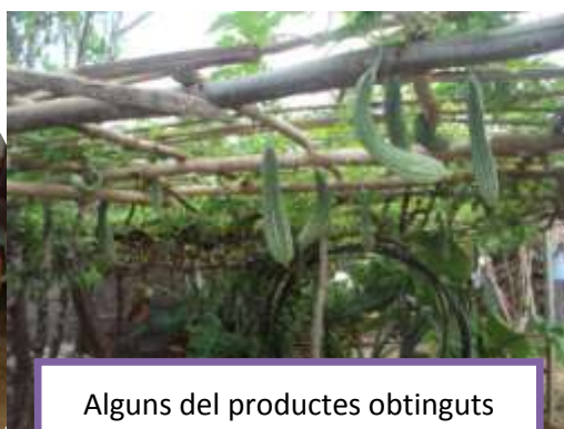
Alguns del productes obtinguts