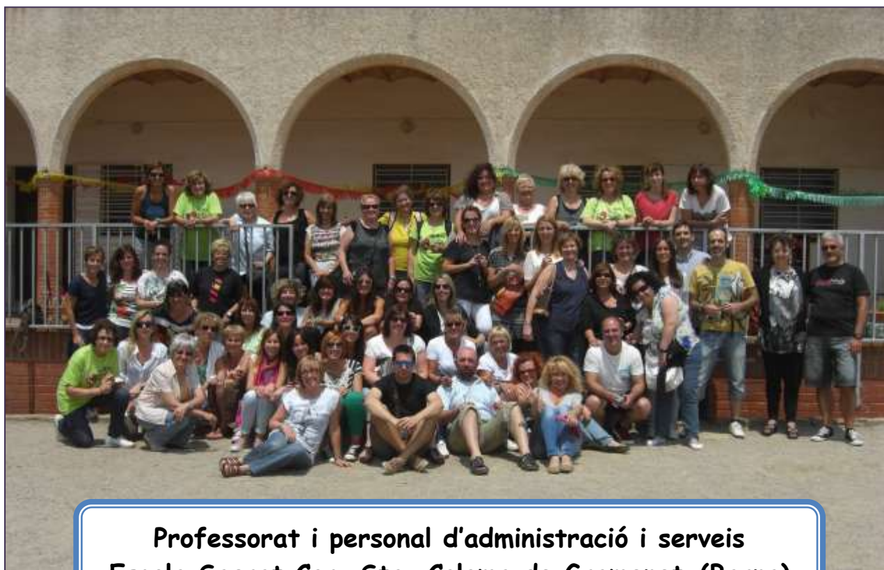
Professorat i personal d'administració i serveis Escola Sagrat Cor -Sta. Coloma de Gramenet-(Barna)