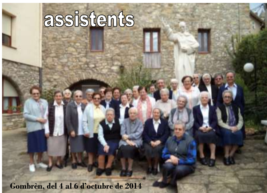
Gombrèn, del 4 al 6 d'octubre de 2014