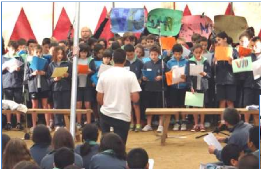
Moment del concert Sant Francesc Coll

Francesc Coll. Algunes de les escoles es van apuntar a participar en aquest concert i prepararen una cançó amb el lema del curs: "Viu, somriu i estima. T'atreveixes?"