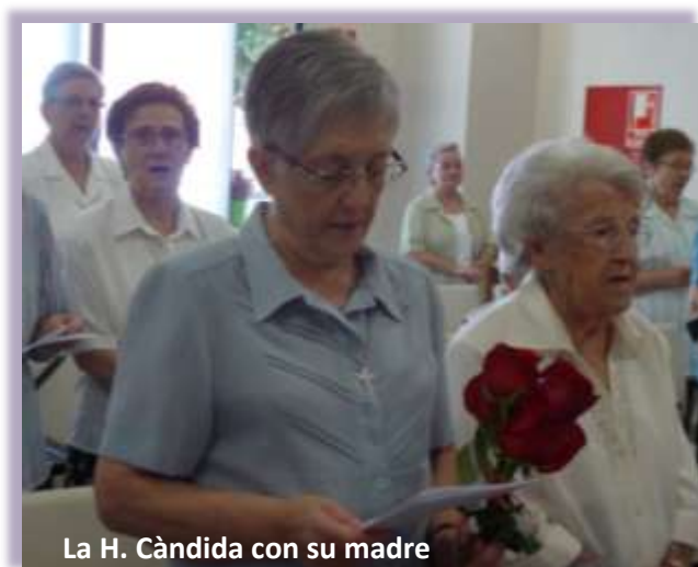
La H. Càndida con su madre

En el momento de la paz el Señor me concedió un nuevo regalo para agradecer: la presencia de mi madre que actualmente tiene 100 años, y de mi hermana y cuñado, los cuales se desplazaron para felicitarme y darme una sorpresa. Fue uno de los momentos más emotivos de la fiesta. En la despedida cantamos el Rosa de abril invocando la protección de la Madre en esta jornada tan entrañable.