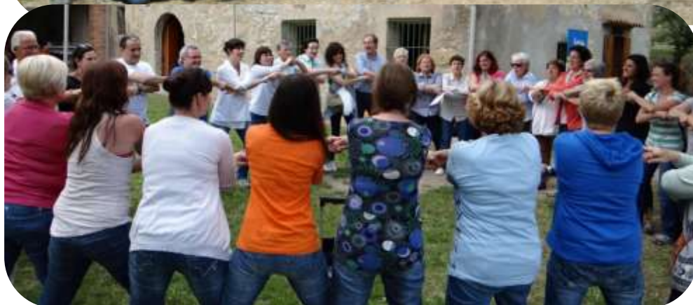
GRUPO PARTICIPANTE EN EL MOMENTO DE LA DESPEDIDA