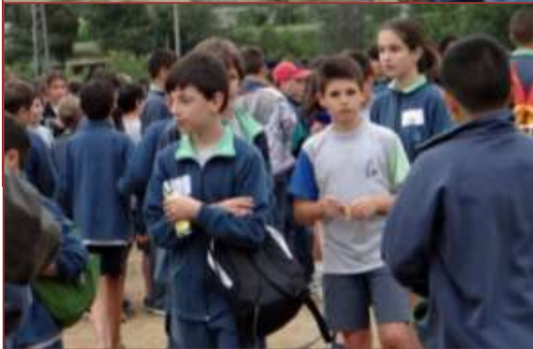
El día 13 de mayo tuvo lugar el "V APLEC PARE COLL". Participaron 680 alumnos y 60 maestros.

Aunque el día fue lluvioso y no nos permitió hacer algunas actividades al aire libre, sí que pudimos realizar el primer concierto músico-pastoral sant Francesc Coll. Las escuelas que se apuntaron habían preparado una canción con el lema del curso: "Vive, sonrío y ama. ¿Te atreves?"