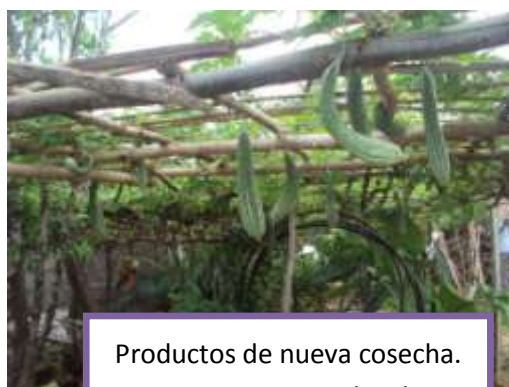
Productos de nueva cosecha. La tierra es agradecida