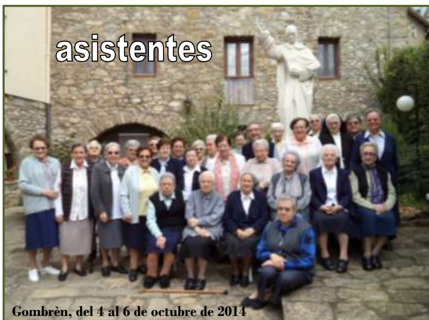
Gombrèn, del 4 al 6 de octubre de 2014