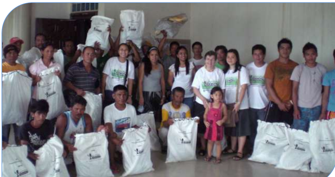
ALGUNOS DE LOS BENEFICIADOS DE LA DISTRIBUCIÓN DE REDES Y OTROS MATERIALES DE PESCA