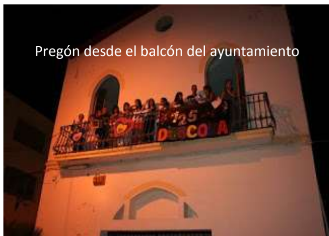
Pregón desde el balcón del ayuntamiento