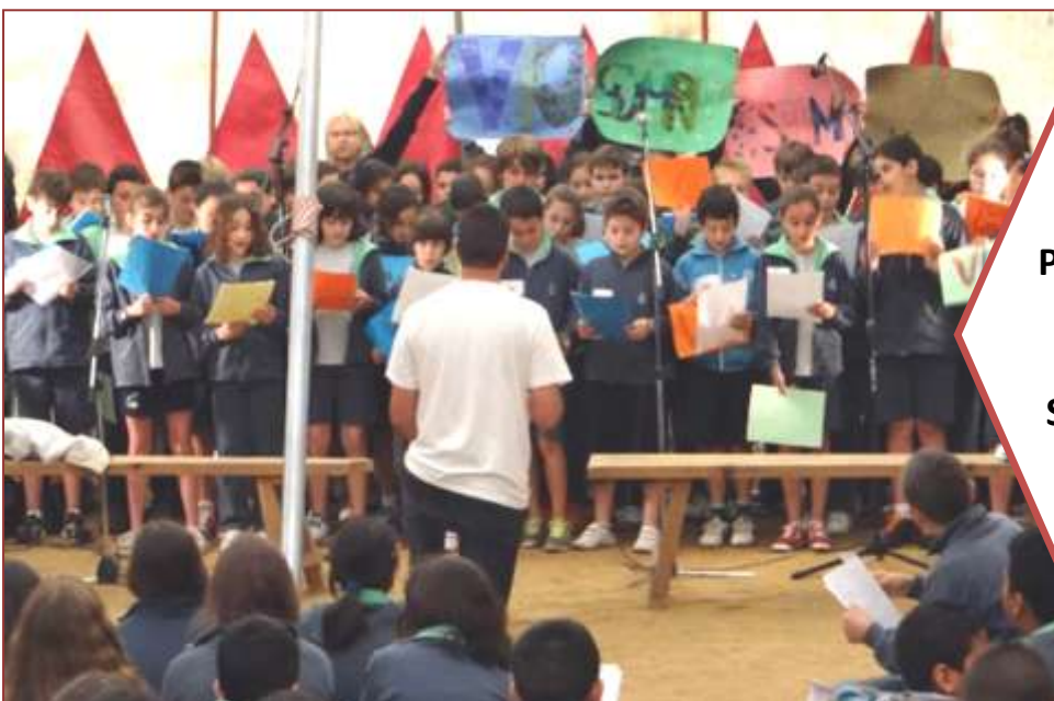
Preparados para el concierto Sant Francesc Coll

Aunque el día fue lluvioso y no nos permitió hacer algunas actividades al aire libre, sí que pudimos realizar el primer concierto músico-pastoral sant Francesc Coll. Las escuelas que se apuntaron habían preparado una canción con el lema del curso: "Vive, sonrío y ama. ¿Te atreves?"