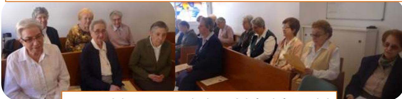
En torno al altar, compartiendo el gozo de la fe y la fraternidad