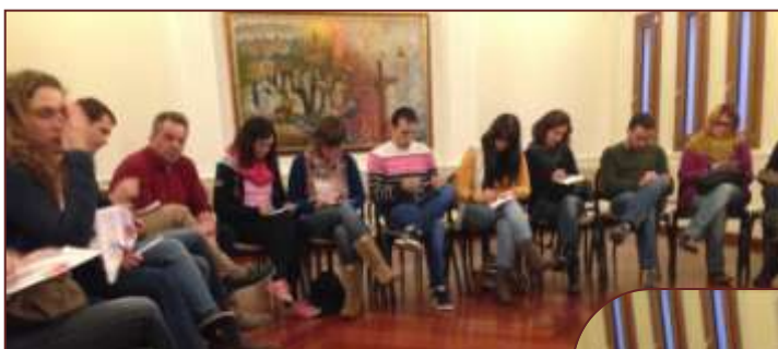
Temps de treball

En un clima de germanor, hem compartit aquests dos dies amb l'objectiu de continuar treballant i esforçant-nos a les nostres escoles i continuar creient aquest gran projecte del que tots formem part.