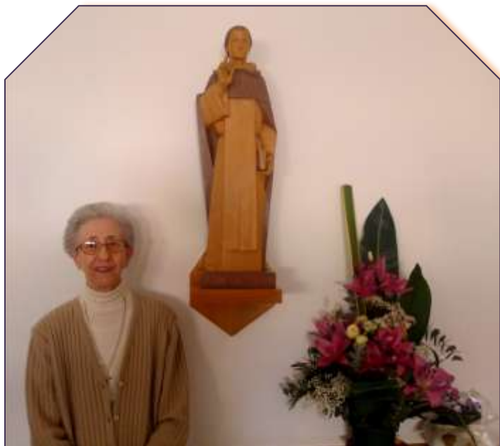
Barcelona, Comunidad Sta. Úrsula-Amílcar

También doy gracias a la Comunidad, a la Provincia, a la Congregación, a mi familia y a todas las personas que se han cruzado en mi vida, porque es mucho más lo que el Señor me ha dado, que lo que yo le he podido dar. Por eso, como la Virgen María puedo decir: “Mi alma glorifica al Señor...”