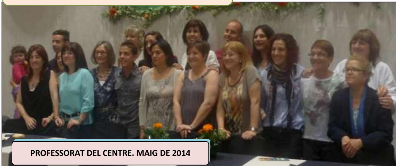
PROFESSORAT DEL CENTRE. MAIG DE 2014