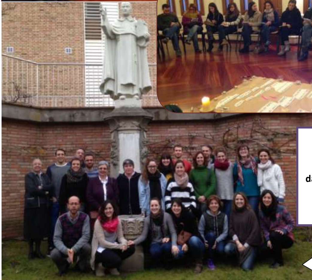
El grup participant davant l'estàtua del Pare Coll