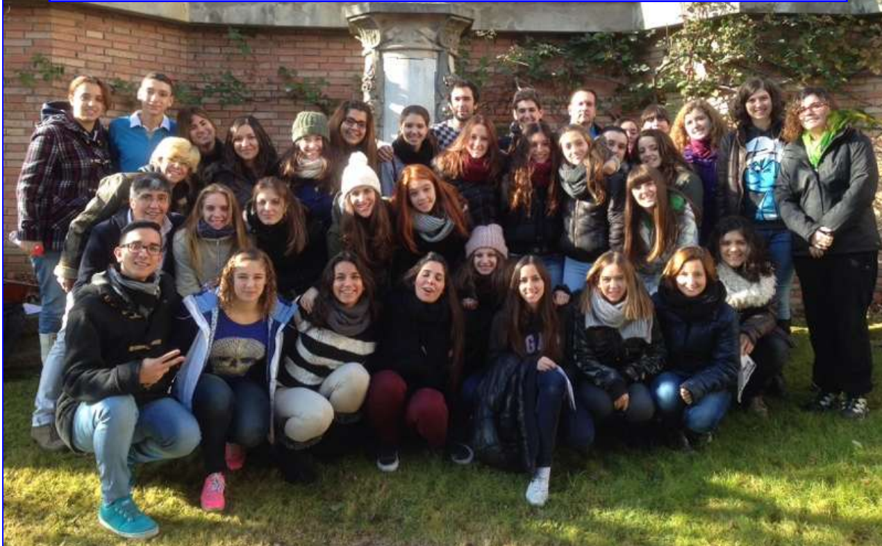
Preanimadors i animadors grups "CREC", Vic 13 y 14 de diciembre 2013

Ens cal vetllar per que aquests/es animadors/es i preanimadors/es trobin en aquest voluntariat un espai on créixer ells/es personalment i on ajudin a créixer els infants, adolescents i joves que estan a les seves mans.