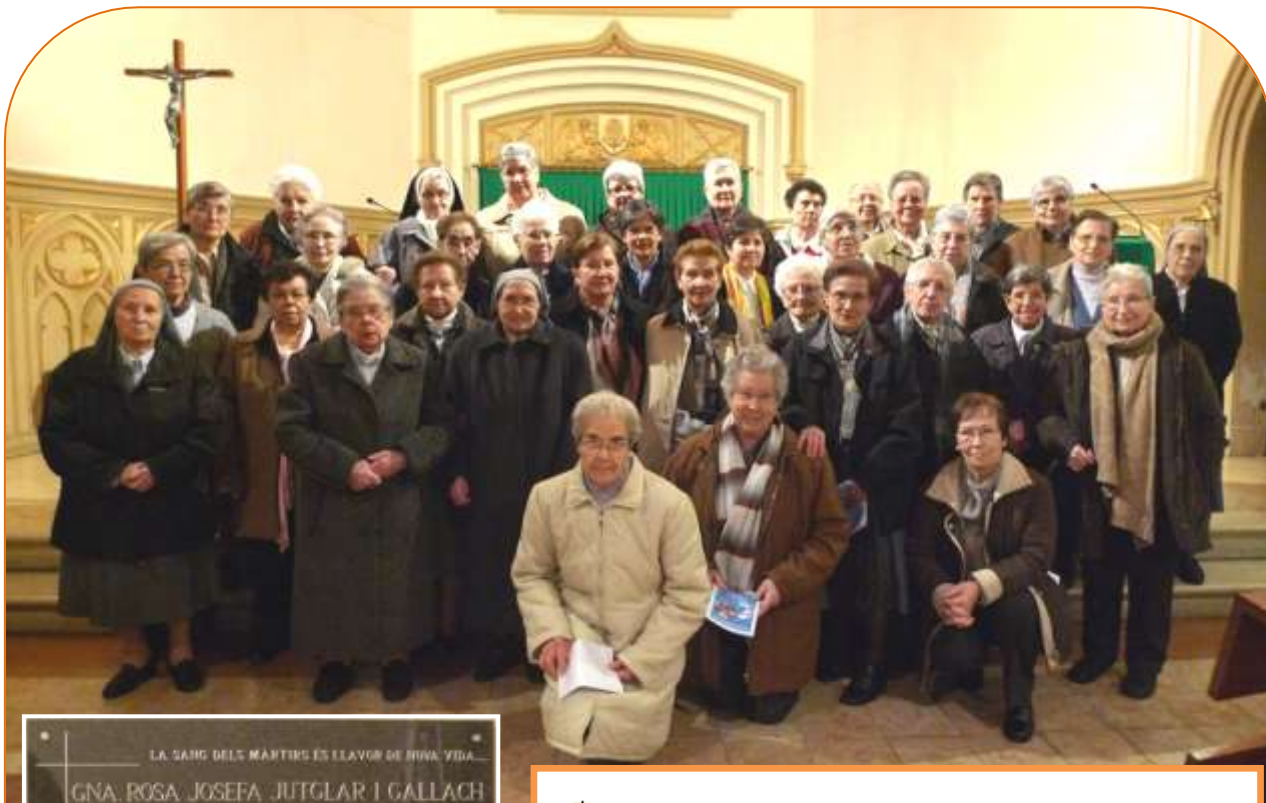
LA SANG DELS MÀRTIRS ES ELAVOR DE NOVA VIDA GNA. ROSA JOSEFA JUTGLAR I GALLACH * SABADINYA 25-I-1906 GNA. REGINA PILAR PICAS I PLANAS * BORRERA 25-V-1893 Religioses Dominiques de l'Anunciata de la Comunitat de Manresa, que feren ofrena de la seva vida a Déu el 27 de juliol de 1936 LA CIUTAT DE BARCELONA EL 27 DE JULIOL DE 1936 12-V-1984