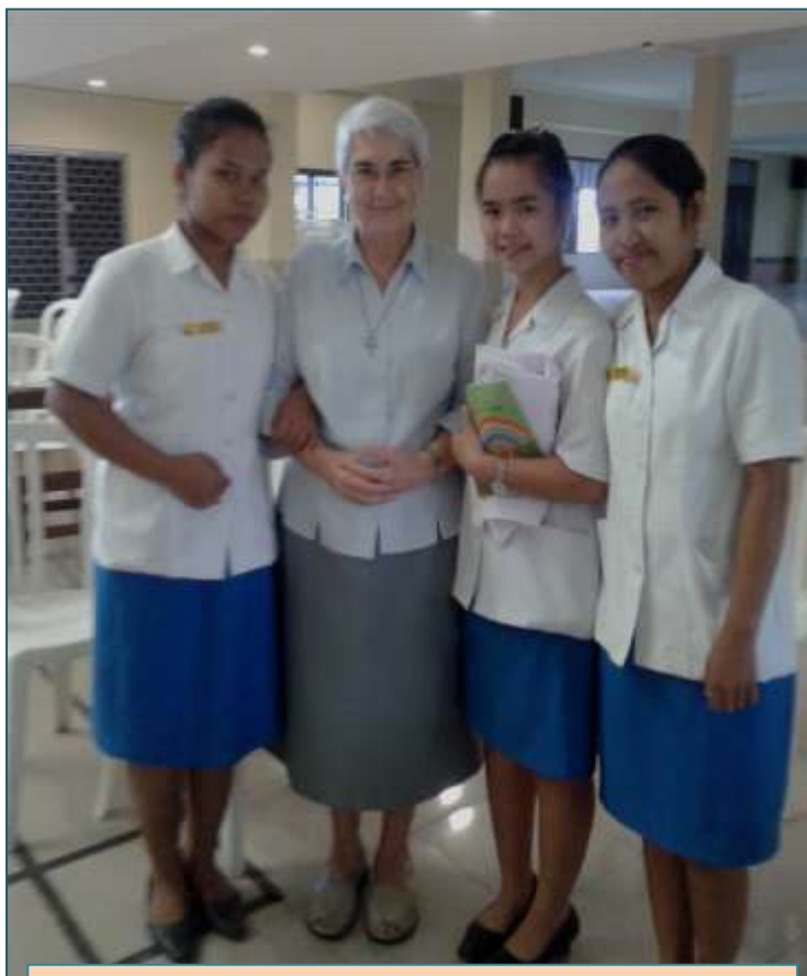
Gna. Nati amb noies universitàries

Germanes que ens van facilitar els contactes, són les encarregades de la Pastoral