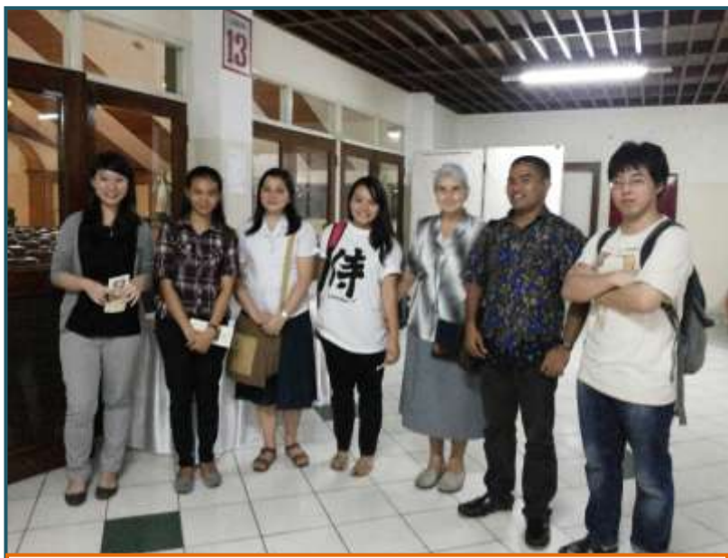
Estudiants de la universitat d'Admajaya

Tot el temps que hem fet promoció vocacional hem experimentat com Déu ens ha anat guiant, com la seva mà i presència estava amb nosaltres. Hem trobat en el camí persones molt bones que ens han facilitat la tasca. A Iakarta, que per mi era una ciutat desconeguda, malgrat ser la capital del meu país, vam tenir l'oportunitat de contactar amb joves que pertanyien a dues parròquies, una parròquia era la de la