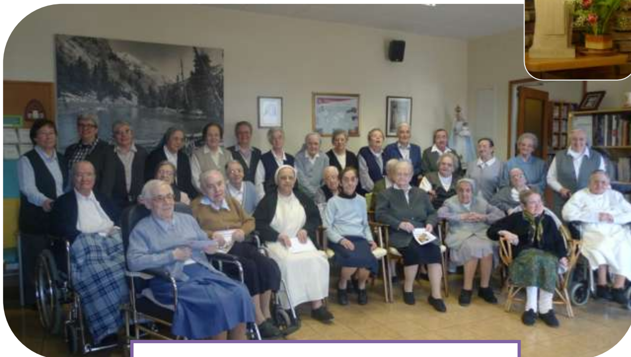
Vic: Comunitat de Vic Infermeria

En general la valoració que han fet d'aquestes trobades, tant les germanes de les comunitats com l'equip organitzador, ha estat positiva y creiem s'han aconseguit els objectius que ens havíem proposat. Gairebé totes les germanes del Consell provincial hi hem participat i això ens ha ajudat a conèixer més les germanes de la Província.