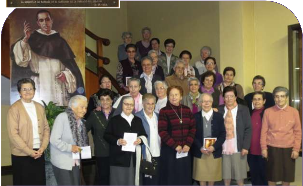
✚ Girona P. Coll: Comunitats de Girona P. Coll i Pont Major, Gombrèn, Cerdanyola del Vallès i Salt