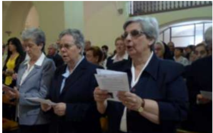
La H. Adelina dando las gracias a los asistentes. La asamblea cantando el himno al Padre Coll

Al terminar la Eucaristía nos dirigimos a Can Comas para visitar la exposición. Trabajo laboriosa fue la recopilación de material: fotografías, labores y documentos, reflejo y síntesis de lo que ha sido la escuela.