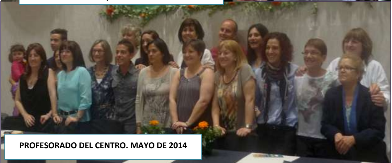
PROFESORADO DEL CENTRO. MAYO DE 2014