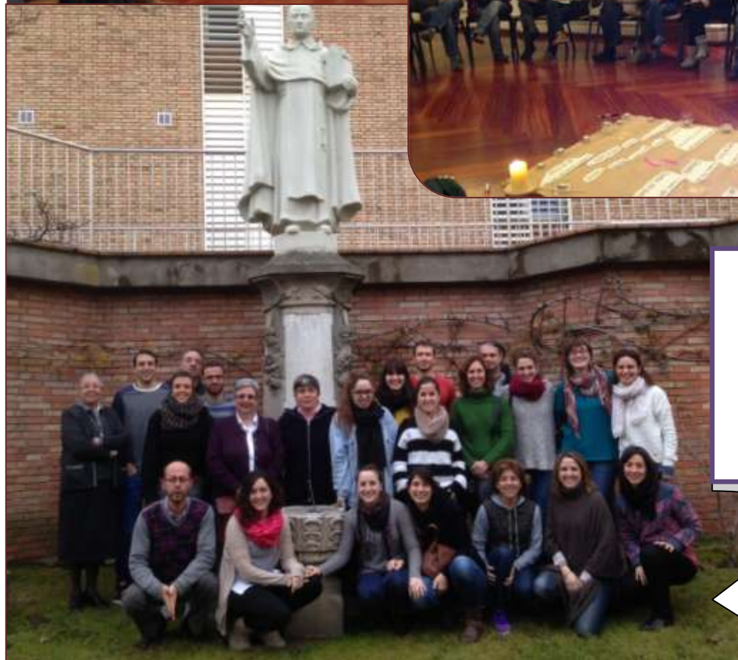
El grupo participante ante la estatua del Pare Coll