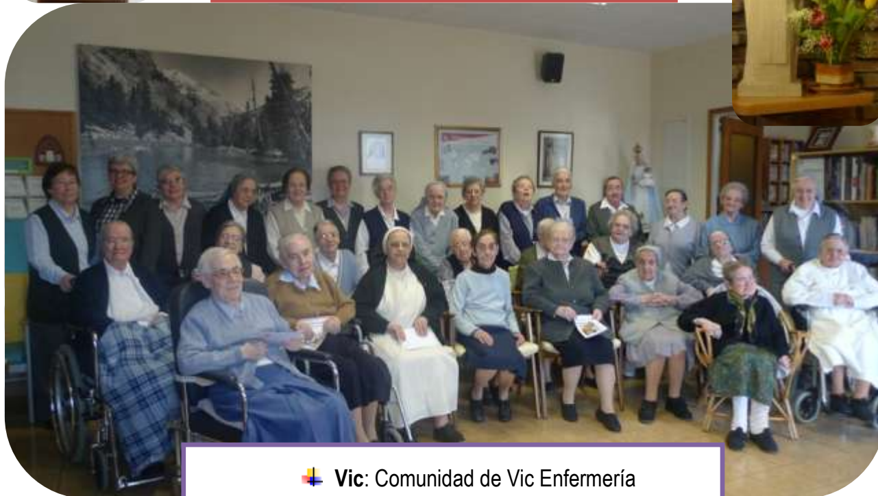
✚ Vic: Comunidad de Vic Enfermería

En general la valoración de estos encuentros, tanto por parte de las hermanas de las comunidades como del equipo organizador, ha sido positiva y creemos que se han conseguido los objetivos que nos habíamos propuesto. La mayor parte de las hermanas del Consejo provincial hemos participado también y ésto nos ha ayudado a conocer más a las hermanas de la Provincia.