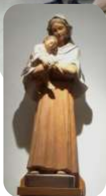
✚ Barcelona-Amílcar: Comunidades de Barcelona-Santa Úrsula, un grup de Barcelona Elisabets, Barcelona-Horta, Sant Feliu de Codines, Súria, Santa Coloma de Gramenet, Sant Vicenç de Castellet, Canet y Pineda