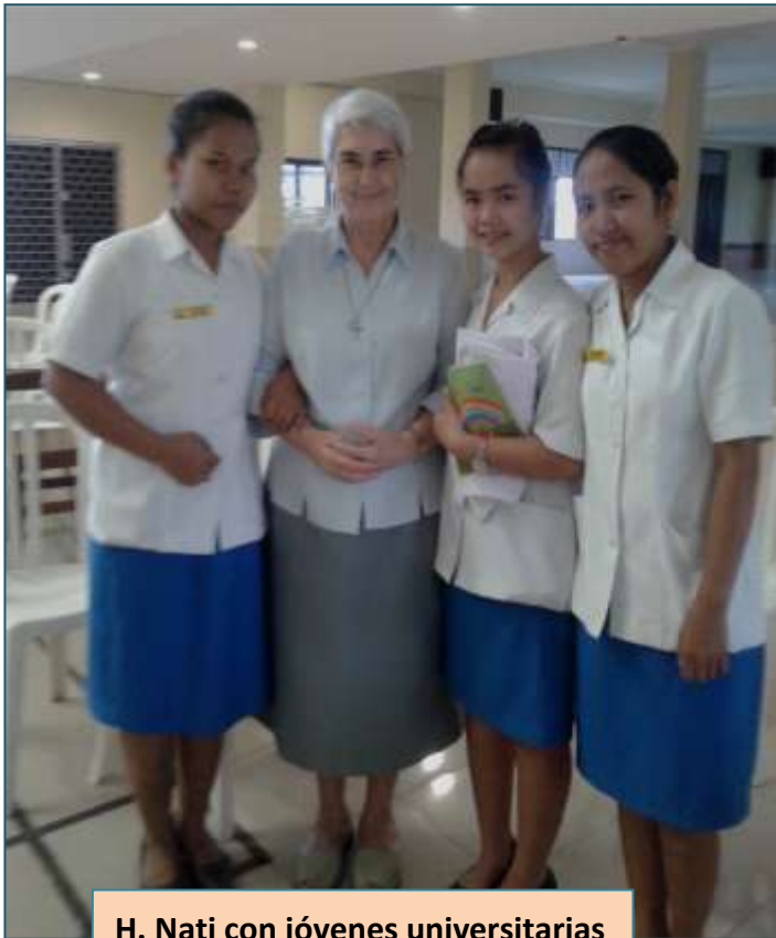
H. Nati con jóvenes universitarias

Para nosotras fue una bonita experiencia al comprobar que las Hermanas que nos facilitaron estos contactos, son las mismas que están encargadas de la Pastoral Vocacional de su Congregación. Un gesto de generosidad por su parte.