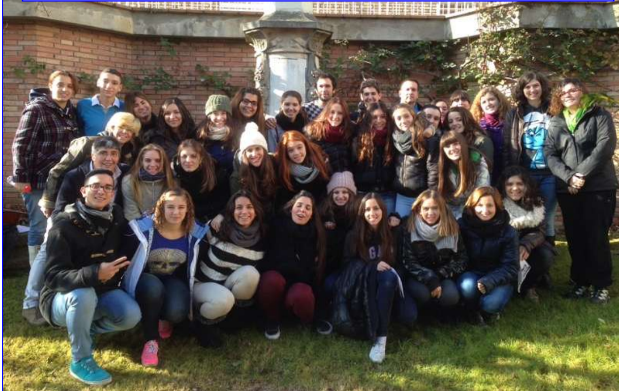
Preanimadores y animadores grupos "CREC", Vic 13 y 14 de diciembre 2013

Necesitamos velar para que estos animadores/as y preanimadores/as encuentren en este voluntariado un espacio donde crecer ellos personalmente y ayuden también a crecer a los niños y niñas, adolescentes y jóvenes que están en sus manos.