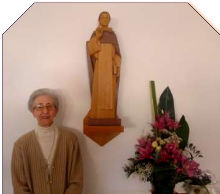
Barcelona, Comunidad Sta. Úrsula-Amílcar

También doy gracias a la Comunidad, a la Provincia, a la Congregación, a mi familia y a todas las personas que se han cruzado en mi vida, porque es mucho más lo que el Señor me ha dado, que lo que yo le he podido dar. Por eso, como la Virgen María puedo decir: “Mi alma glorifica al Señor...”