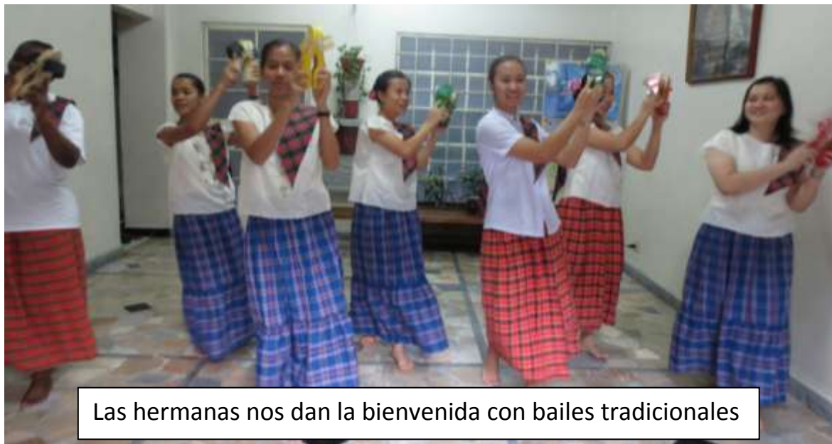
Las hermanas nos dan la bienvenida con bailes tradicionales