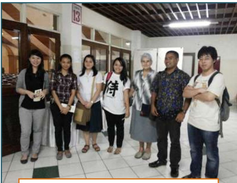
Jóvenes de la universidad de Admajaya

Encontramos en nuestro camino muy buenas personas que nos facilitaron la tarea. En