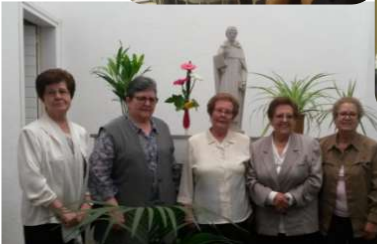
Hermanas de la comunidad de Pineda de Mar. Mayo de 2014