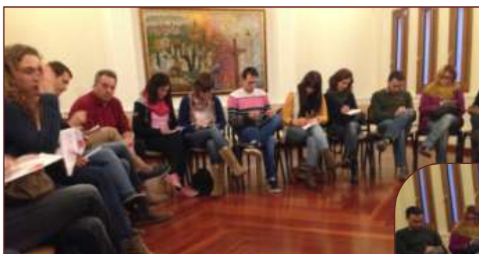
Tiempo de trabajo