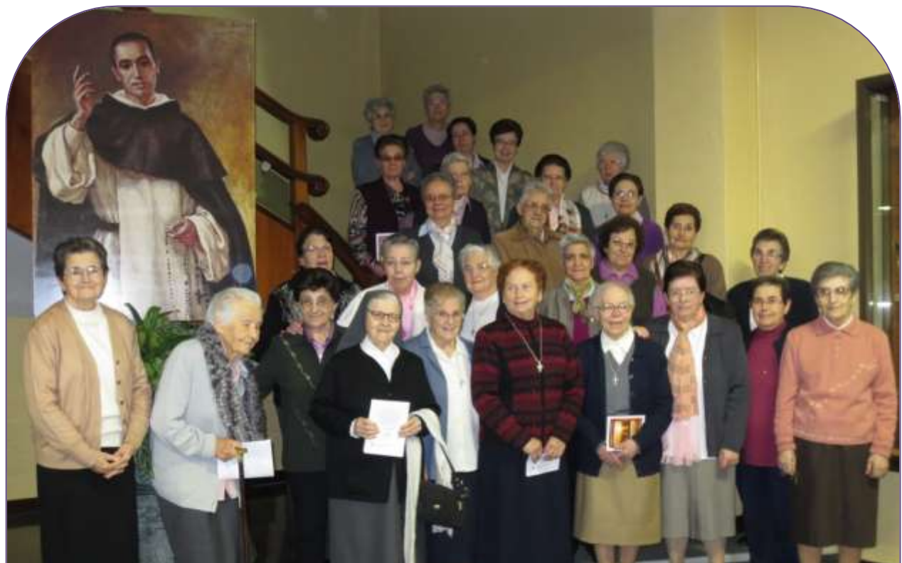
✚ Girona P. Coll: Comunidades de Gerona P. Coll y Pont Major, Gombren, Cerdanyola del Vallès y Salt