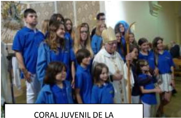
CORAL JUVENIL DE LA PARROQUIA CON EL Sr. OBISPO

Fue muy emotivo el momento de la ofrenda de flores por un grupo infantil del Colegio.