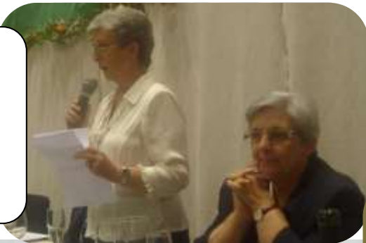
Parlamento de las Hnas. Justina y M ª Isabel y de la directora del centro.